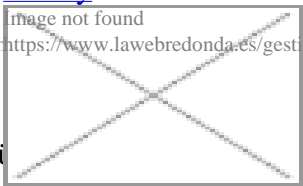
image not found https://www.lawebredonda.es/gestonable/sites/all/themes/ibroker/