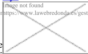
image not found https://www.lawebredonda.es/gestonable/sites/all/themes/ideas/