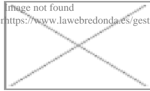
image not found https://www.lawebredonda.es/gestonable/sites/all/themes/havasú/