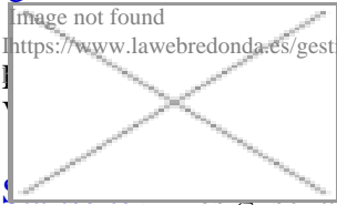
image not found https://www.lawebredonda.es/gestonable/sites/all/themes/green/