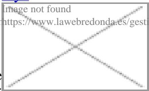
image not found https://www.lawebredonda.es/gestonable/sites/all/themes/ideas/